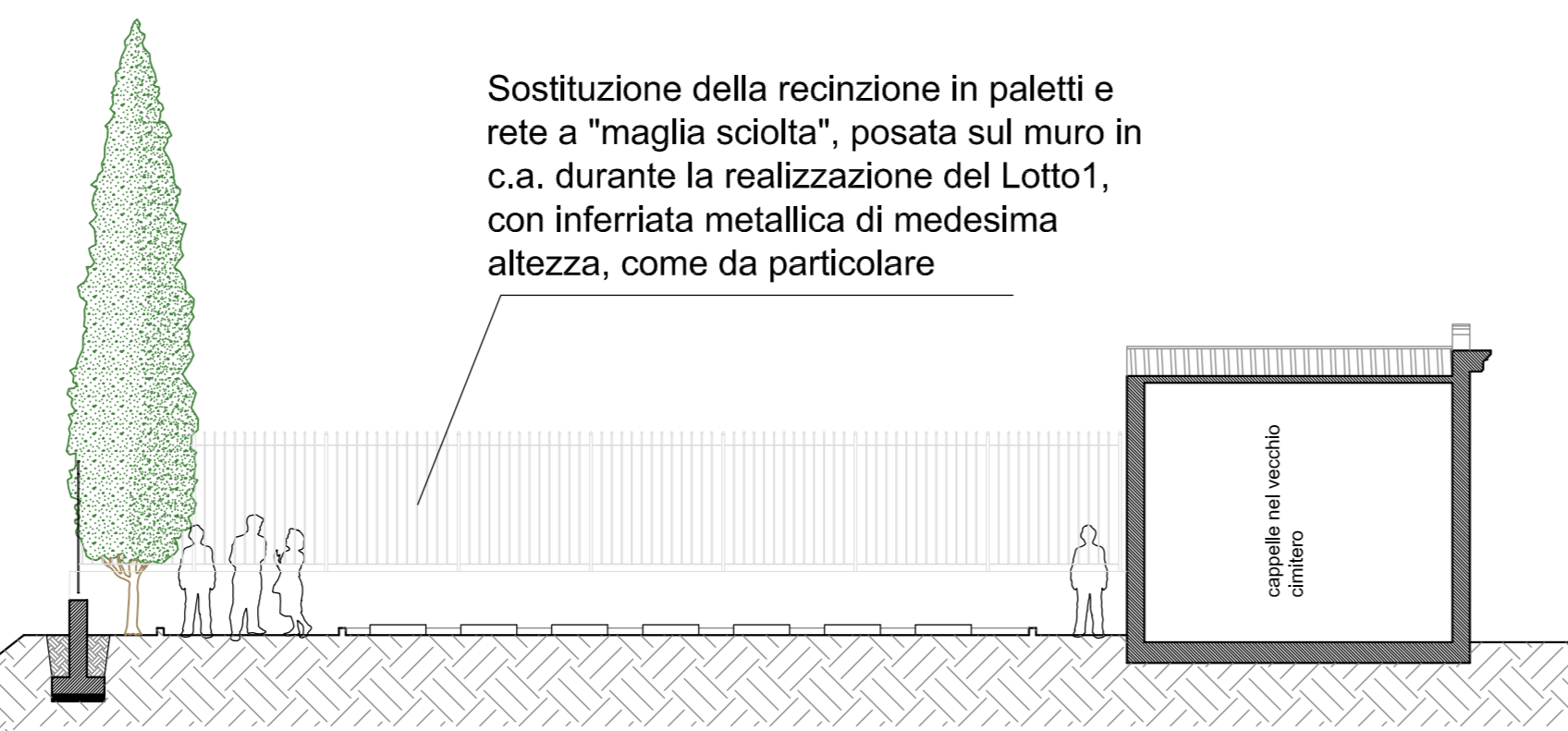
SEZIONE GG scala 1:100

Sostituzione della recinzione in paletti e rete a "maglia sciolta", posata sul muro in c.a. durante la realizzazione del Lotto1, con inferriata metallica di medesima altezza, come da particolare