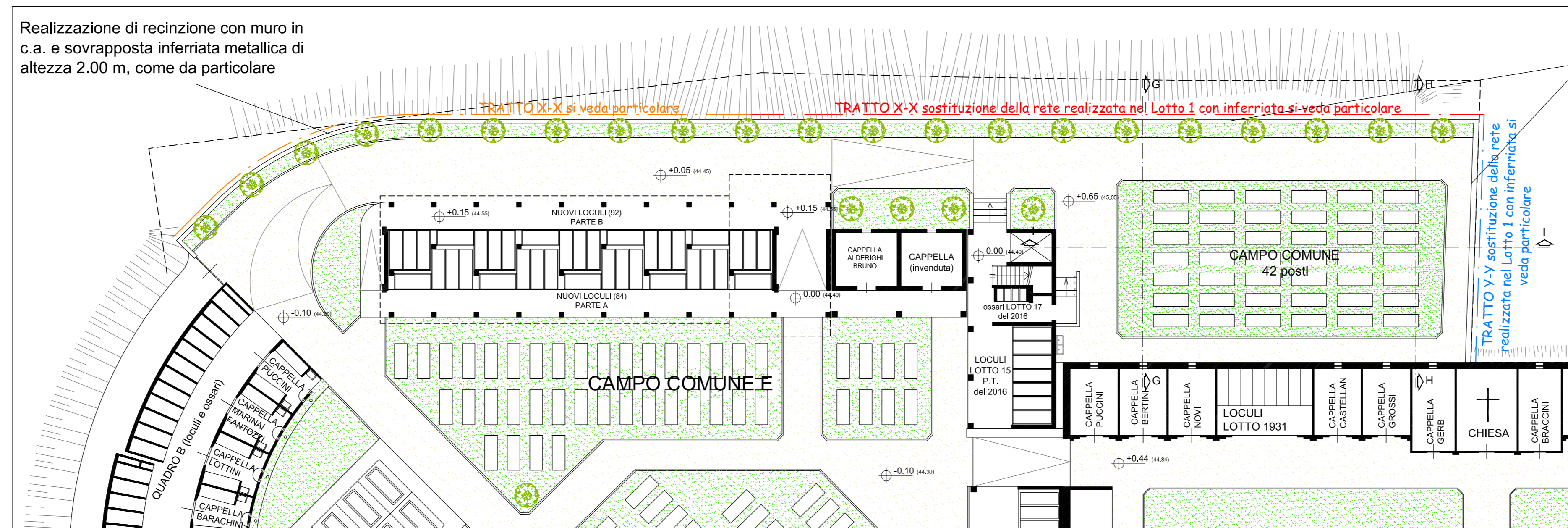
DETTAGLIO PIANTA PIANO TERRA 1:200

Realizzazione di recinzione con muro in c.a. e sovrapposta inferriata metallica di altezza 2.00 m, come da particolare