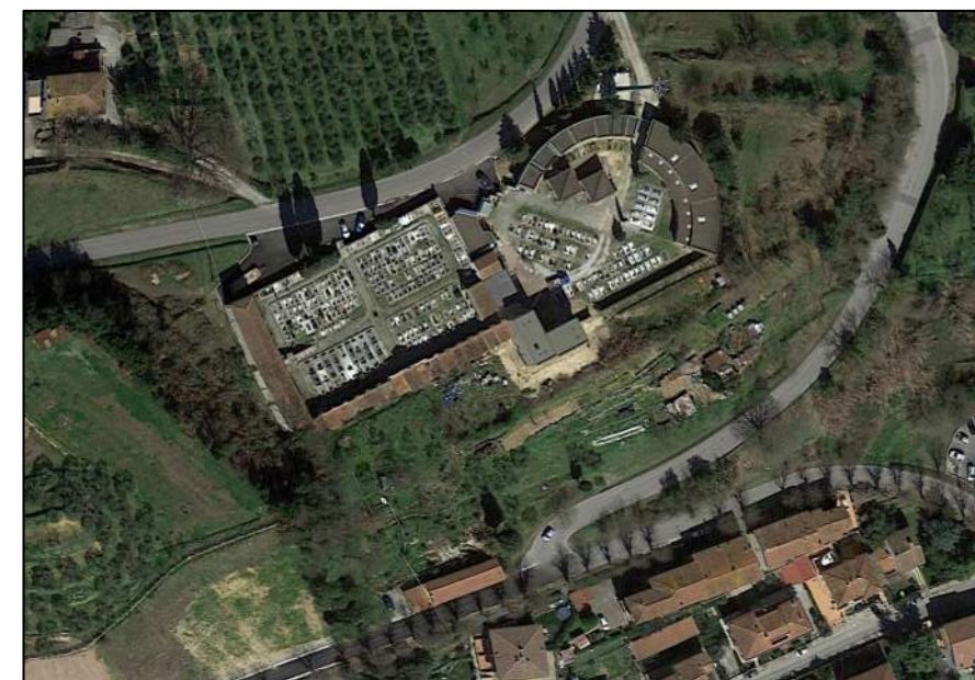
TAVOLA n° A15 26/05/2020

AMPLIAMENTO CIMITERO MONTECALVOLI Via del Cimitero di Montecalvoli PROGETTO DI FATTIBILITA' TECNICO ECONOMICA